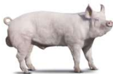
LARGE WHITE ITALIANA

La materia prima destinata alla produzione del Prosciutto Amatriciano I.G.P. è rappresentata esclusivamente dalla coscia fresca di: