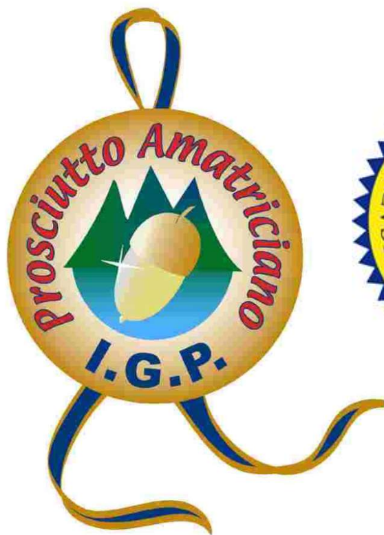
Logo prosciutto amatriciano igp

ONAS ® ORGANIZZAZIONE NAZIONALE ASSAGGIATORI SALUMI