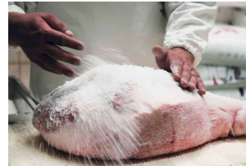
IL PROSCIUTTO AMATRICIANO IGP

Curiosità: (sembra che siano solo donne a massaggiare questo prosciutto)