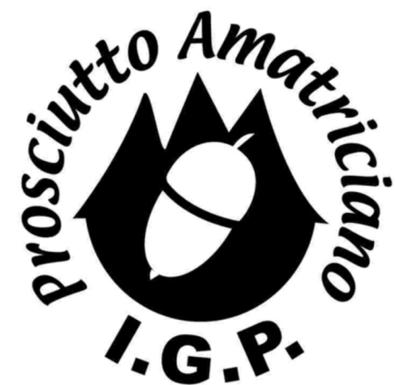
Marchiatura a fuoco