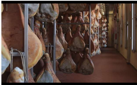
IL PROSCIUTTO AMATRICIANO IGP

A causa dell'azione disidratante del sale, le cosce hanno subito un calo di peso complessivo del 2% o più. I gambi vengono appesi in posizione verticale.