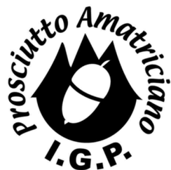
IL PROSCIUTTO AMATRICIANO IGP

Il peso minimo di ciascun prosciutto è di 8 chilogrammi.