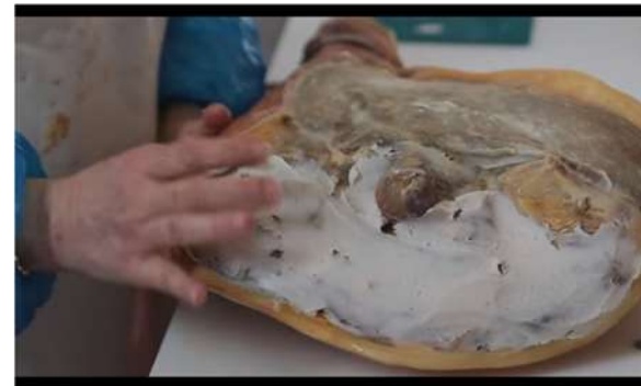
IL PROSCIUTTO AMATRICIANO IGP